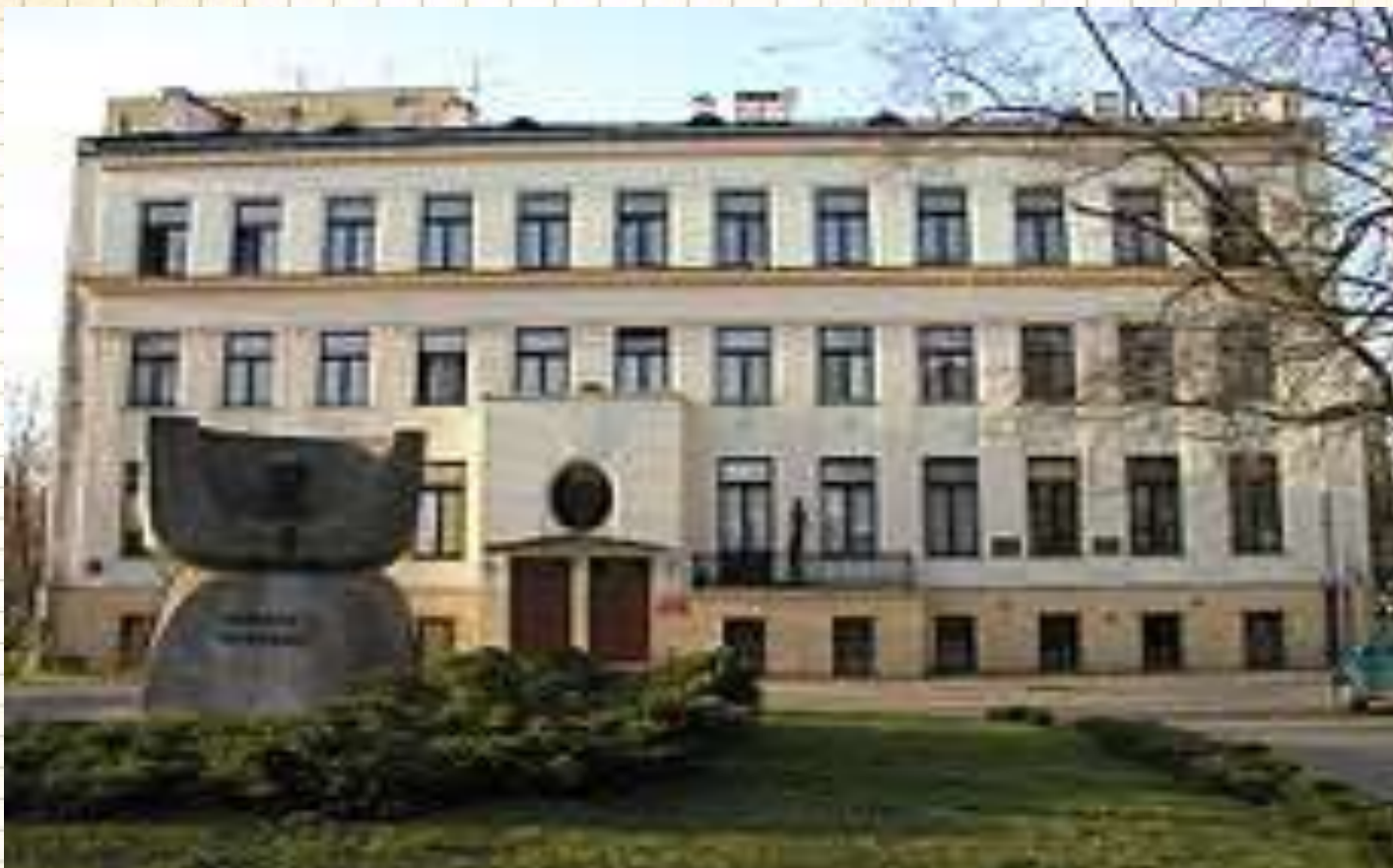
Детский дом Корчака в наше время.