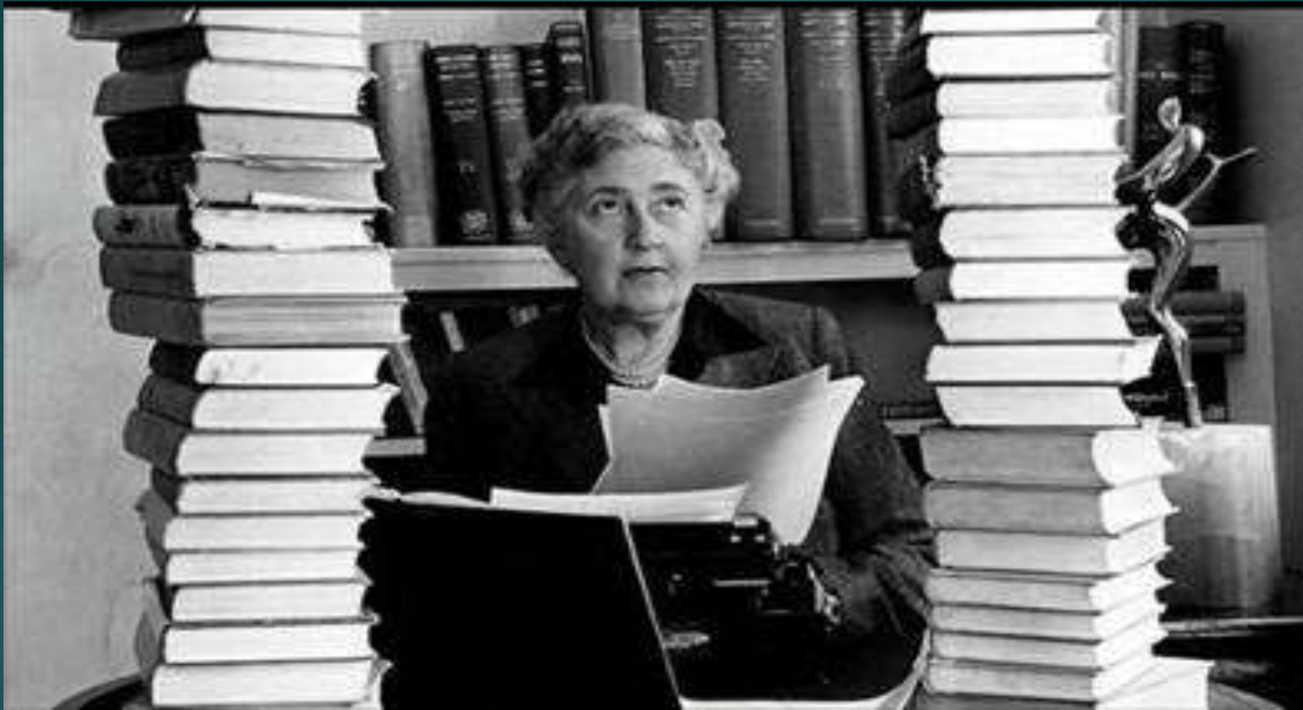
ΑΓΑΘΑ ΚΡΙΣΤΙ (15.09.1890 – 12.01.1976)